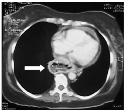
Figura 1. Tomografía axial contrastada con corte a nivel de mediastino, en la que se visualiza lesión hipodensa que ocupa y disminuye la luz del esófago, con afectación de la capa muscular del mismo, que corresponde al caso de metástasis de CaRCC a esófago.