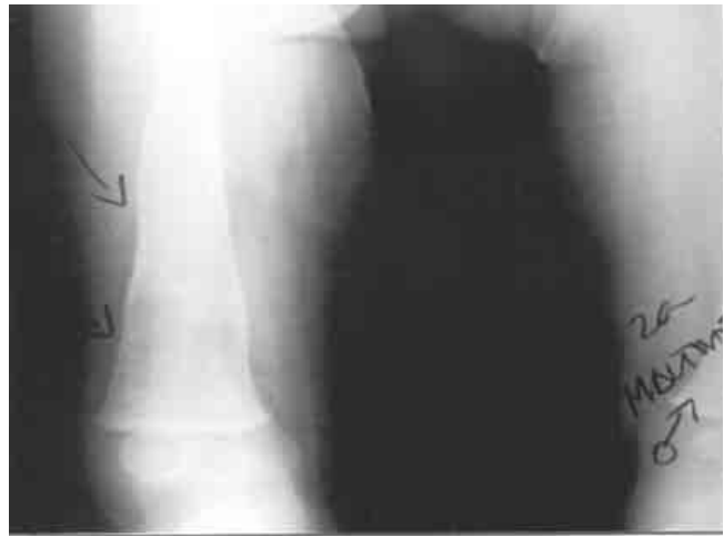
Figura 4. Fractura de fémur al menos tres semanas después de haber sucedido. Puede observarse que la remodelación ósea casi ha finalizado.

mediante programas de prevención terciarios 1 se puede modificar esta manera de perpetuarse; no respeta ideología ni color de piel, y carece de distribución geográfica específica. Se observa en todas las culturas, en pobres y en ricos y sin ser una condición sistémica, no se conoce área del cuerpo humano que no haya sido afectada. 2