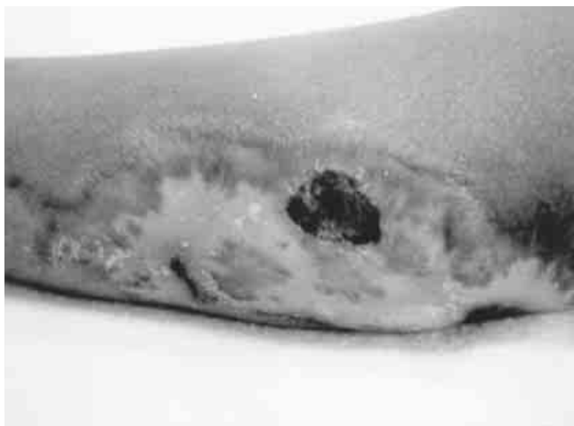
Figura 1. No obstante que la lesión estaba en vías de cicatrizar, se pueden apreciar islotes de tejido cruento que probablemente iban a requerir injertos de piel.

F emenino de 2 años de edad que tiene como antecedente el haber sufrido pérdida espontánea del estado de alerta unos días antes de ser llevada a sala de urgencias de nuestro hospital con dolor abdominal y vómito fecaloide. En la exploración física se le encontraron lesiones cutáneas diversas y quemadura de segundo y tercer grado en pierna derecha (Figura 1), así como signos evidentes de abdomen agudo, motivo por el cual fue llevada a sala de operaciones en donde la laparotomía reveló la presencia de sección casi completa de ileon (Figura 2). La evolución en la sala de terapia intensiva fue desfavorable ya que sufrió neumotórax derecho, sepsis, coagulación intravascular diseminada, hemorragia pulmonar sobreviniendo la muerte seis días después de haber sido operada. El tío materno la golpeaba consuetudinariamente.