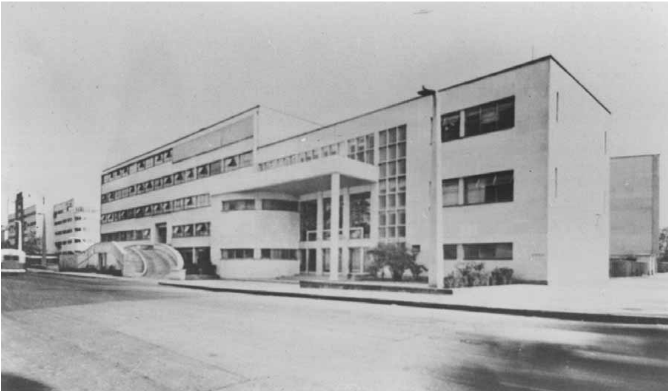
Figura 3. El antiguo Instituto Nacional de Cardiología de México (1944).

Hermann Boerhaave Communis Europae praeceptor . Londres, Oxford y Viena heredaron y desarrollaron los cambios preceptivos y semánticos de la técnica de diagnóstico, a la que llama Foucault: 14 "mirada perfeccionada". El método de esta enseñanza no tardó en difundirse también en Gotinga y Pavía, donde el doctor Giovanni Battista Borsieri estableció la cátedra de clínica médica en 1770. Dicho método se organizó admirablemente en los hospitales militares franceses 15 y luego en los españoles como el de Barcelona y el de Cádiz. Más aún aparecieron las especializaciones en medicina: por 1787 ya existía en Copenhague una clínica especializada para partos. 16 Entre tanto el enfoque clínico de la medicina se había integrado con el anatomopatológico, sobre todo en virtud de la obra maestra de Giovanni Battista Morgagni, 17 anatomicorum princeps y de sus continuadores.