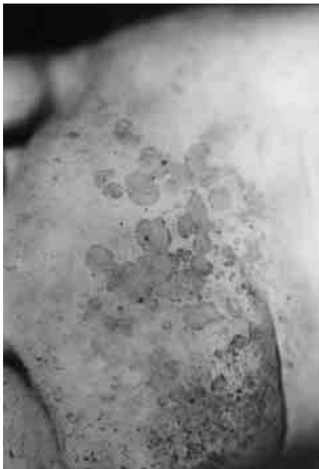
Figura 3. Queratólisis punteada.

La incidencia de portadores de dermatófitos en niños mestizos, en la ciudad de México es de 6.09%, siendo T. rubrum el agente causal más frecuente. 6 En un estudio