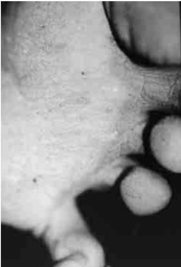
Figura 1. Tiña de los pies interdigital.

En el cuadro II se presentan los datos de los niños con muestras positivas al examen directo, según la localización y el sexo. Los pacientes con cultivo positivo fueron 9/16, en Tinea pedis 7/16 y en onicomicosis 2/3. Los agentes causales se muestran en el cuadro III.