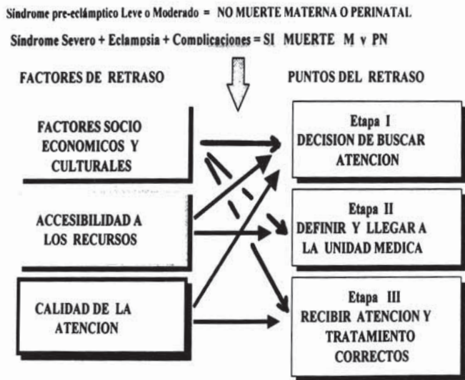
Figura 1. Causas de la eclampsia y de muerte materna/ prenatal.